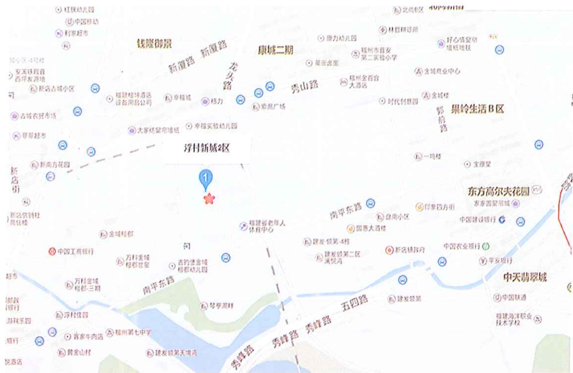
图 3-1 项目地理位置图

浮村新城二区（原琴亭一期）项目位于福州市晋安区新店镇南平东路北侧规划用地范围内，项目南临南平东路，西临万科金域榕郡，北临铎兴小区，东临32m宽规划路。地理位置图详见图 3-1，项目布置及监测点位图详见图 3-2。